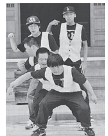
↑ダウン症や知的障害のある若者でつくるダンスクラブチーム『スーパーボーイズ』結成は昨春秋。メンバーは松本養護学校卒業生等。